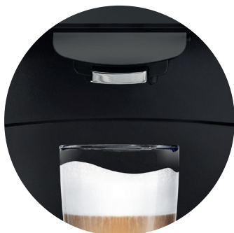
automatyczne czyszczenie systemu mlecznego