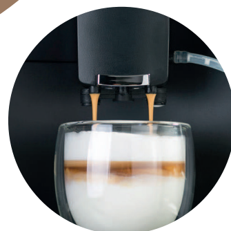
funkcja one touch cappuccino