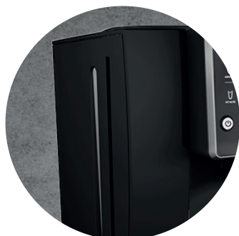
2-litrowy zbiornik wody